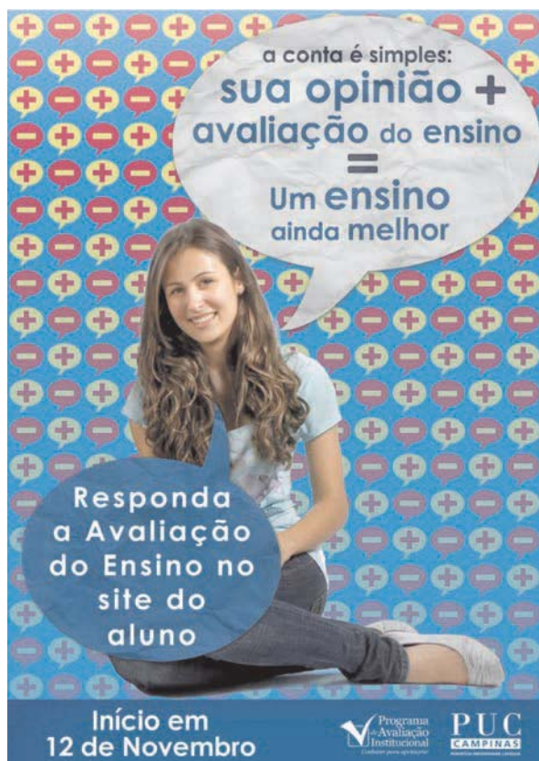
Figura 2 - Cartaz de divulgação da Avaliação do Ensino no 2º semestre de 2010

Atualmente, o instrumento de avaliação docente é composto pelas dimensões descritas a seguir: