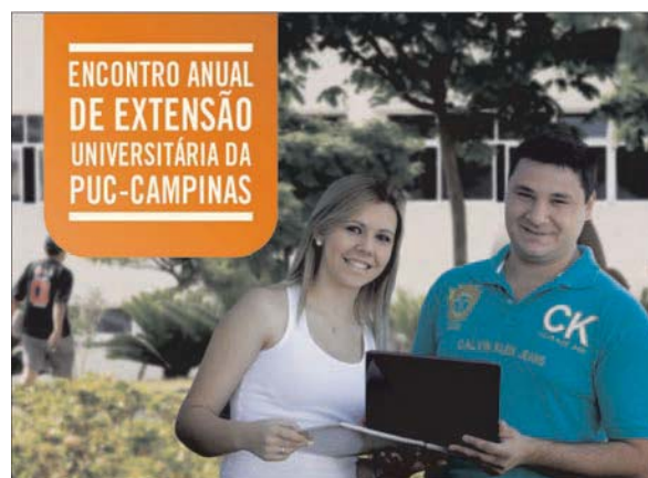
Figura 4. Cartaz do Encontro Anual de Extensão (2011)