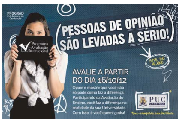
Figura 3. Banner de divulgação da Avaliação do Ensino 2º semestre de 2012

A Avaliação do Ensino da PUC-Campinas, projeto desenvolvido pela PROGRAD e integrado aos propósitos do Programa de Avaliação Institucional da Universidade (PROAVI), reafirma a Política de Graduação. Esse projeto contempla as exigências legais do Sistema Nacional de Avaliação da Educação Superior (SINAES), entretanto, para além dos fins legais, possibilita garantir um processo de avaliação contínuo, indo ao encontro da missão da PUC-Campinas: um ensino de qualidade e a formação integral de um cidadão crítico, ético e atualizado em relação às necessidades da sociedade contemporânea e exigências profissionais.